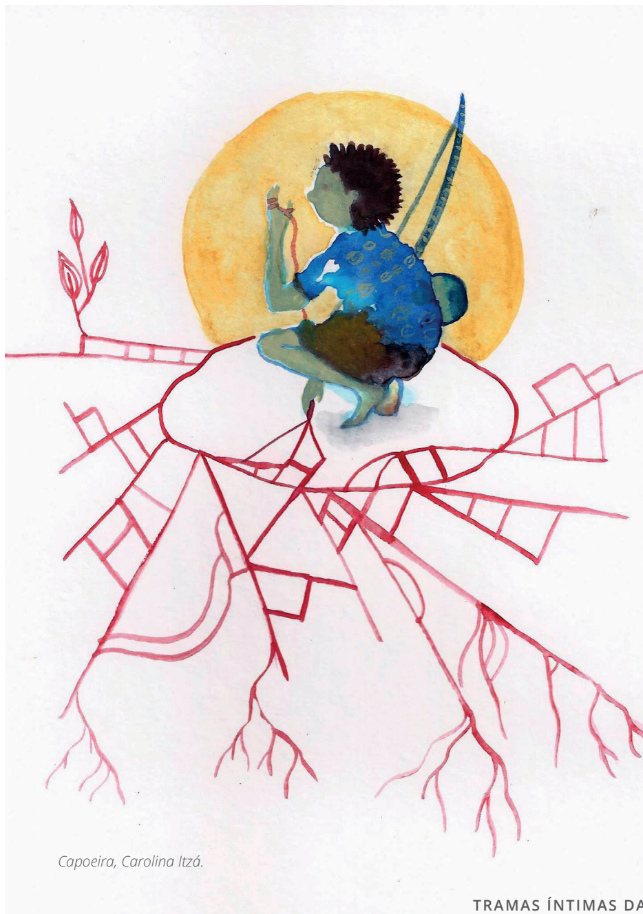
Capoeira, Carolina Itzá.